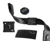
IronTag® Tags industriels UHF