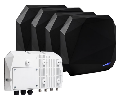
SPECTRE Lecteur multi-antenne UHF