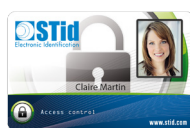
CCT Badges UHF & bi-fréquences