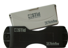
TeleTag® Tags pare-brises UHF